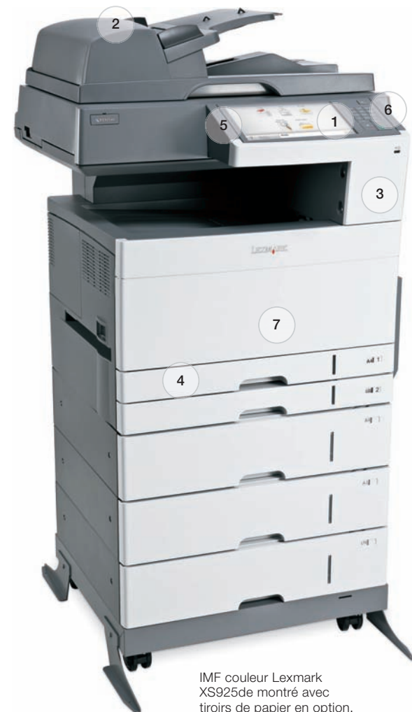
IMF couleur Lexmark XS925de montré avec tiroirs de papier en option.