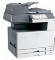
Lexmark XS925de Pièce n° 24Z0387